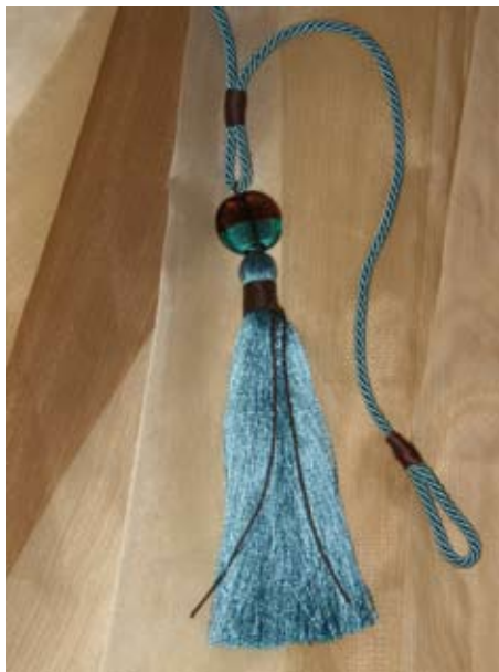
5 400130 877 türkis • turquoise 2 Stück • 2 pcs.