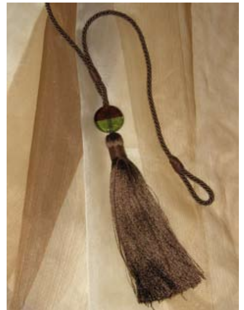
5 400130 504 braun • brown 2 Stück • 2 pcs.