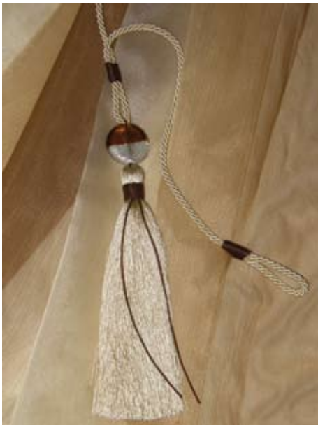
5 400130 250 beige • beige 2 Stück • 2 pcs.